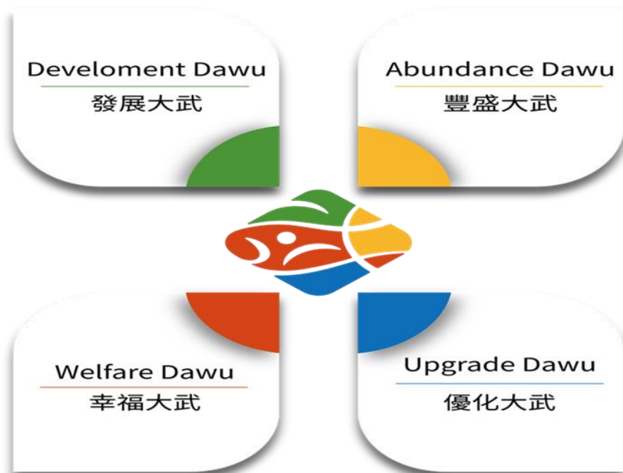
施政四大面向示意圖

以下僅就 109 年 10 月 1 日起至 110 年 04 月 30 日止，(以下簡稱本會期)推動鄉政之施政成果，擇要向諸位代表報告。